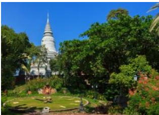
Battambang 📍 🚗 325km - ⌚ 6h Phnom Penh 📍