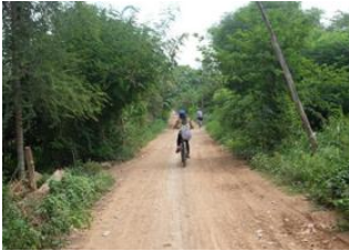
Battambang 📍 🚲 20km - ⌚ 3h Battambang 📍