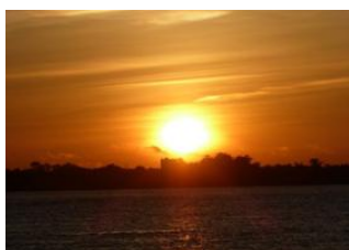
Phnom Penh 📍