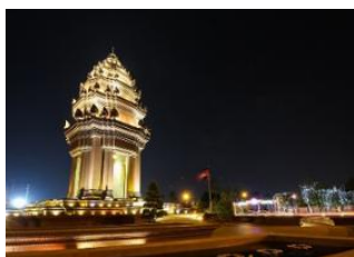
Airport Phnom Penh 📍 🚗 7km Phnom Penh 📍