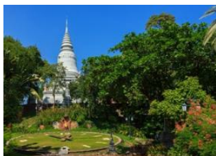
Kratié 📍 🚗 250km - ⌚ 5h Phnom Penh 📍