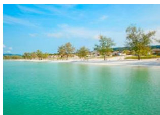
Koh Rong 📍