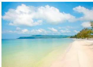
Koh Rong 📍