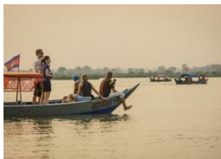
Kratié 📍 🚲 5km Kratié 📍