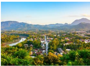
Luang Prabang 📍