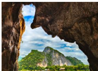
Pak Ou 📍