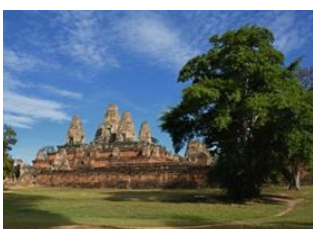
Siem Reap 📍 7km - ⌚ 20m