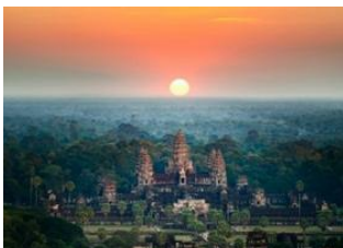
Luang Prabang 📍 ✈️ - ⌚ 3h Siem Reap 📍