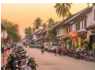
Luang Prabang 📍