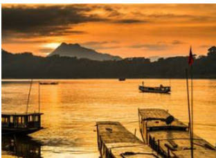
Luang Prabang 📍