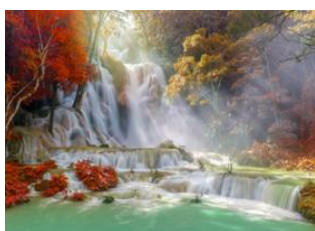
Chutes de Kuang Si 📍