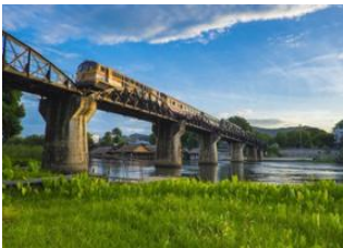
Amphawa 🚗 100km - ⌚ 2h Kanchanaburi