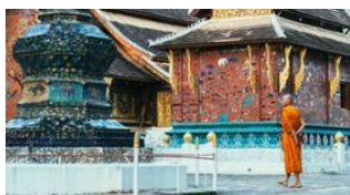
Luang Prabang 📍

d'authenticité. Retour à l'hôtel pour le petit-déjeuner en passant par le marché du matin.