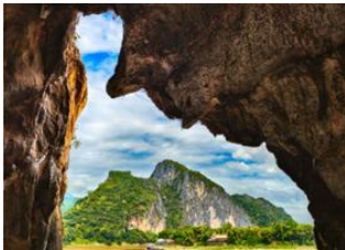
Pak Ou 📍