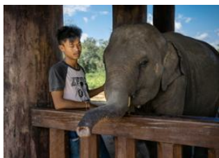
Camps d'éléphants 📍