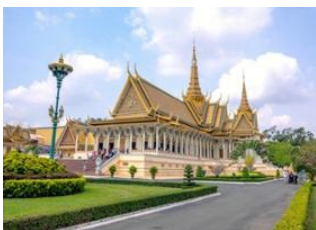
Phnom Penh 📍