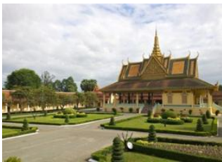
Airport Phnom Penh 📍 🚗 9km Phnom Penh 📍